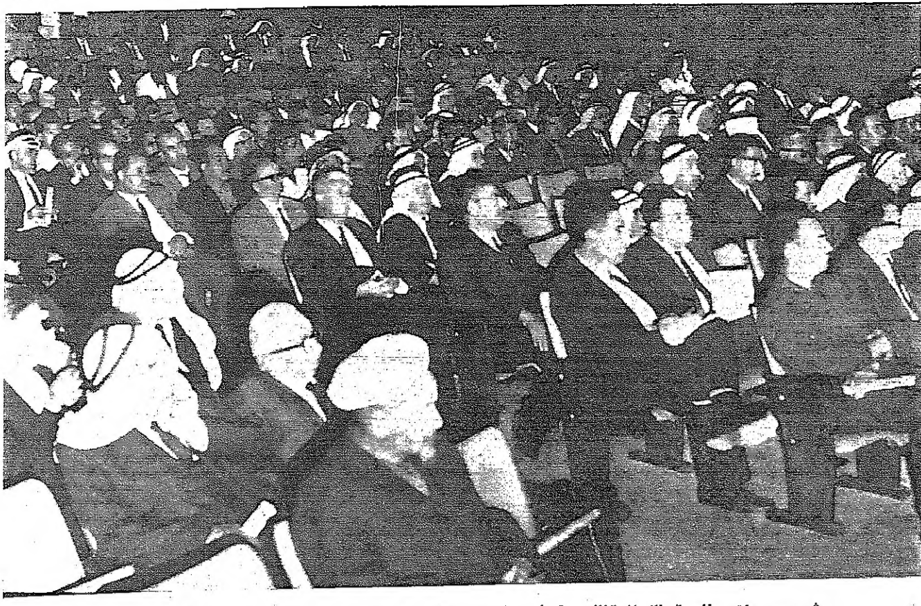
مشهد من مؤتمر الجبهة الإسلامية الذي عقد أمس في قاعة الكلية العلمية الإسلامية بعمان

أخي .. والله ، أشعاري يضاف لمن ما في نسر - فوفوق قصادي ، نثري يضاف لمن ما في الكتف ، من شمر ، ومن نسر ! يضاف لمن من خيطوا ، ومن كثبوا على الدهر ! أذا قيسوا بأجمعهم - بين قبضوا على الجبر ! بين بلوا ، بين ضصوا - رصاصه بأسل ، حر بغضدي من الجبشي بجسدي من سن الأردن ، وفي صديق العهد من الجسد الذين ضصوا - من الجسد ، كالأسد من الجسد الذين ضصوا - نداء القدس ، والمهد ومن قد قسروا الأعداء - ، درس الحر المهد بجسدي من الجبشي - وما أدراك لما الجندي أبعمك كل أشعاري - ومكتبي وما عندي بكل القدر ، والشعر وكل مجامع العلم ، وكل رواع الأجداد وكل أصالة الفصحى ، وعلى الأيام ، والحرب رصاصات ، يبدوها - على الصمم ، من كتب أبي سميت تعرفه - بلا اسم ، وبلا لقب أبي من بني قسومي - قسداني من العرب أخي قسيما يا بوطني أخي .. قسيما يا بوطني أخي قسيما ، بين جدوا - بأرواح .. وإموال أخي قسيما ، بين جدوا - ضحوا غداً ، أذل سبرج سمننا وطننا - أحلوه لظلال سنبهه ، سنسببه - لا لجمال .. وأجبال بارض القدس موعداً - بارض الوطن الفصالي